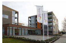
De locatie in Nuenen

De films worden traditiegetrouw gewoon vertoond in Het Klooster. In deze nieuwsbrief meer informatie over de concerten en films. We hopen u ook in de zomermaanden (weer) te zien bij één of meerdere van onze activiteiten.